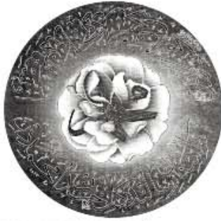
Продолжение, начало на с. 1