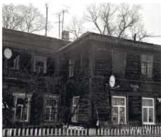
Два из них — это купеческие дома. Один долгое

считать ли купеческие дома и мечеть, входящую в состав РДУМ УО в составе ЦДУМ России, памятниками истории и культуры. На данный момент они относятся к категории выявленных объектов культурного наследия.