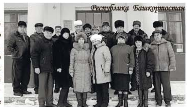
Учредители махалля «Нур»